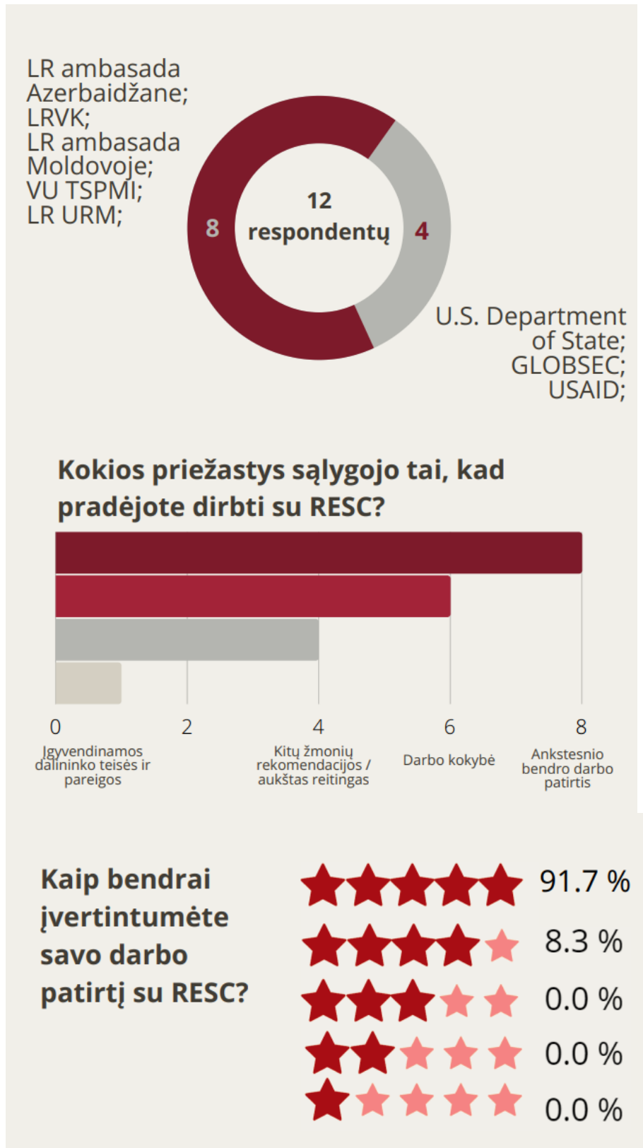
Grafikas Nr. 1. RESC partnerių apklausos rezultatai

Centras 2020 m. pabaigoje atliko svarbiausių partnerių apklausą, prašant įvertinti bendradarbiavimo su Centru efektyvumą, taip pat pateikti pastabas dėl tobulintinų aspektų. Apibendrinti rezultatai pateikiami apačioje.